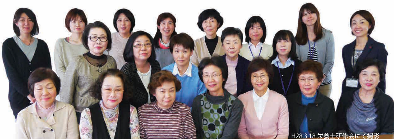
H28.3.18 栄養士研修会にて撮影