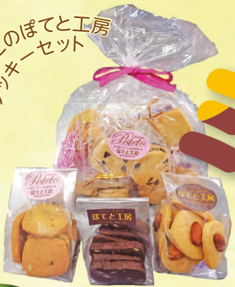
① さかどのぼてと工房 クッキーセット