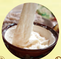
② マサキファームの 自然蜜