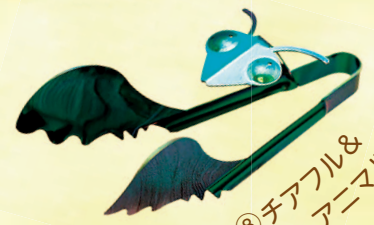
⑧ チアフル& アニマル雑貨