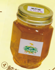
④ 純粋坂戸はちみつ