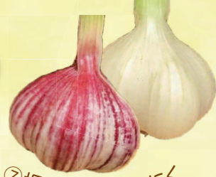
⑦ 坂戸パワーにんにく