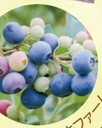
② マサキファームの ブルーベリー