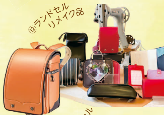
⑫ 林カバン店 オリジナルランドセル