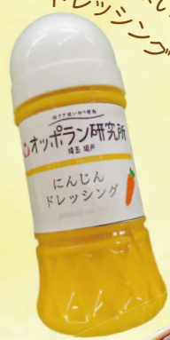
③ チームうまいもん ドレッシング