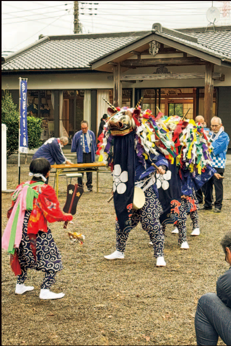
多和目天神社の獅子舞 10/19㊼