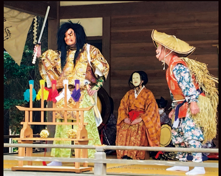
大宮住吉神楽・新嘗祭 11/23㊼