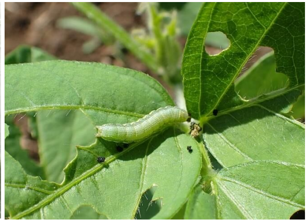
写真4 ダイズ葉を食害する シロイチモジヨトウ老齢幼虫