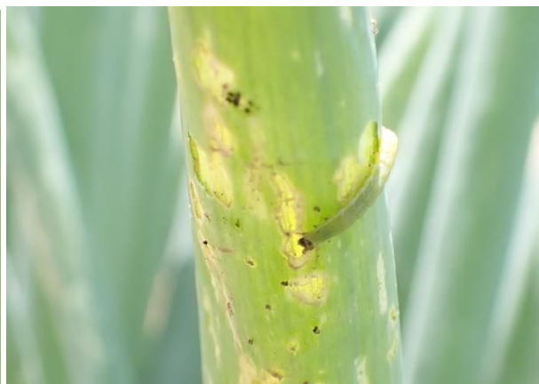
写真2 ネギを食害するシロイチモジヨトウ中齢幼虫