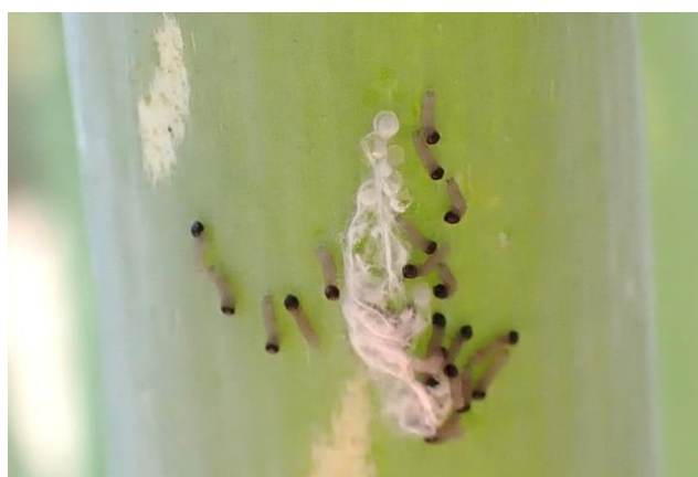
写真1 ふ化直後のシロイチモジヨトウ若齢幼虫（ネギ葉）