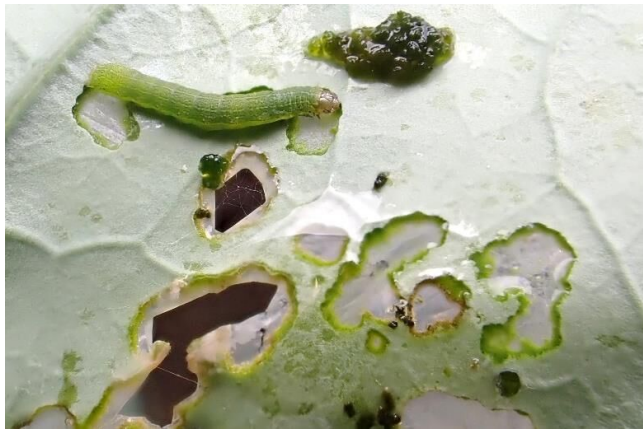
写真3 ブロッコリー葉を食害する シロイチモジヨトウ老齢幼虫