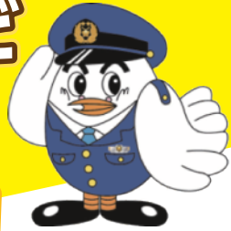
シンボルマスコット ポッコくん

>>>>>>>> 「保険が使える」という住宅トラブルなどの相談事例 <<<<<<<<<