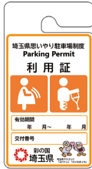
妊産婦・ けが人用