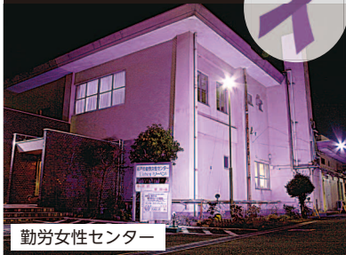
勤労女性センター

女性に対する暴力根絶のシンボルであるパープルリボンにちなみ、11月10日(金)～25日(土)に勤労女性センターと坂戸駅をパープルにライトアップします。女性へのあらゆる暴力の根絶を広く呼びかけ、「ひとりで悩まず、まずは相談をしてください。」というメッセージが込められています。