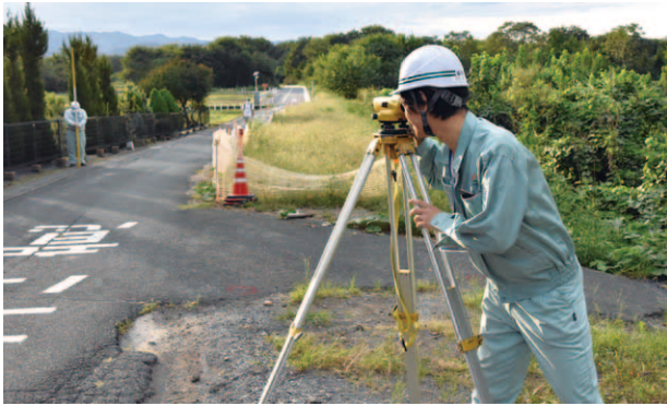
測量機器で距離を測っています。