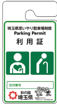
その他障害者・ 要介護者等用