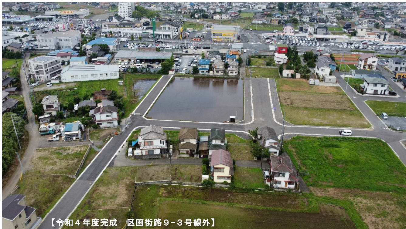
【令和4年度完成 区画街路9-3号線外】