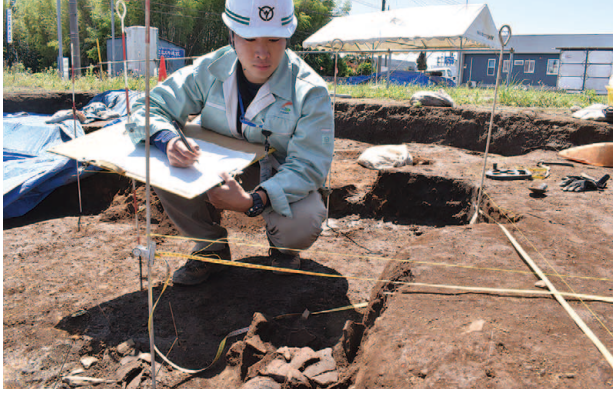
図面を作成し、遺跡の情報を詳細に記録します。