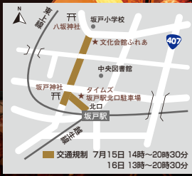
坂戸神社八坂祭交通規制

15日(土) 14時～20時30分 16日(日) 13時～20時30分 場所 坂戸中心市街地 (日の出町、本町、仲町、元町地内) 間商工労政課 (内線347)