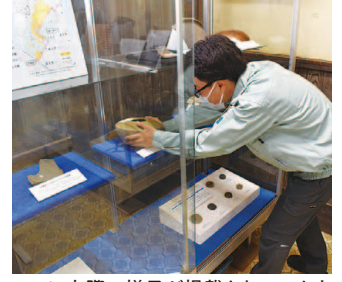
P17に実際の様子が掲載されています

歴史民俗資料館で様々なテーマ展示を行い、文化財の魅力を発信します。資料館以外の施設で出張展示を企画することもあります。