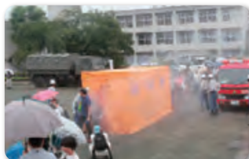
防災訓練 (鶴ヶ島市)