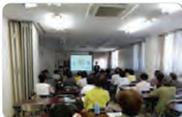
大学連携講座(坂戸市)