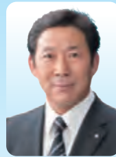
毛呂山町長 井上 健次