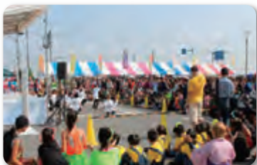
レインボーまつりin川島(川島町)