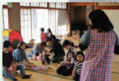
子育てサロン(川島町)