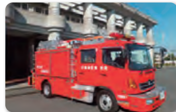
川越地区消防組合 (川越市・川島町)