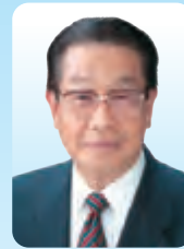
越生町長 新井 雄啓