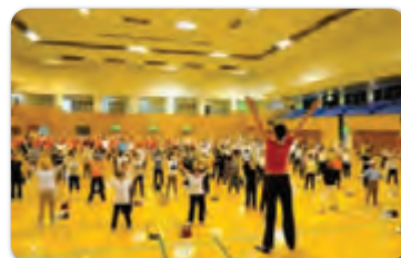
めざせラジオ体操マスター (川越市)