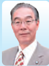
鶴ヶ島市長 藤縄 善朗