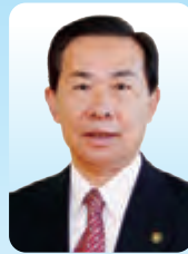
日高市長 谷ヶ崎 照雄