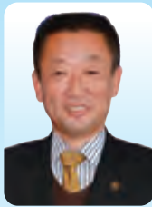
坂戸市長 石川 清