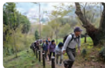
ハイキング大会(越生町)