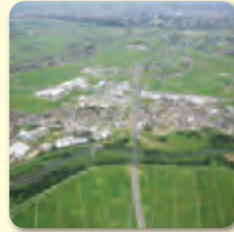
圏央道川島IC (川島町)