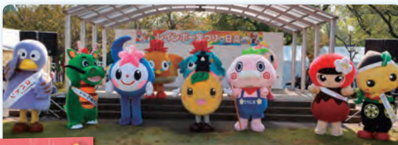
レインボーまつりin日高(日高市)