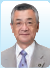
川越市長 川合 善明