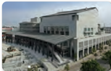
ウエスタ川越 (川越市)