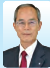
川島町長 飯島 和夫