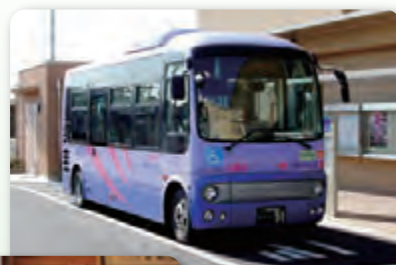
市内循環バス(川越市)