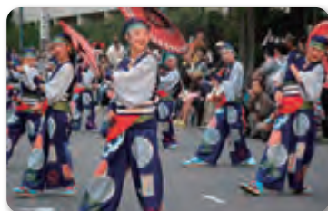
坂戸よさこい (坂戸市)