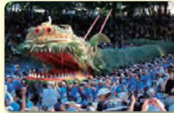
脚折雨乞 (鶴ヶ島市)