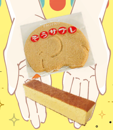
お菓子の家 PAOPAO ぞうサブレ、パティスリーのカステラ