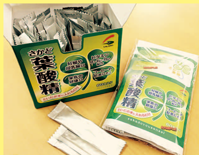
せんし堂薬局 一本松店 さかど葉酸精