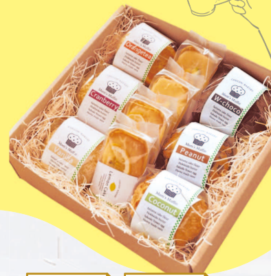
café COUCOU カフェの焼菓子ギフト