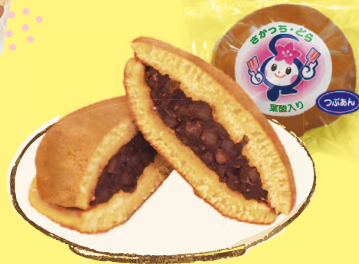
和菓子処さかど さかちどら焼き