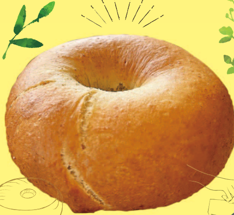
SUNNY food works かりんベーグル