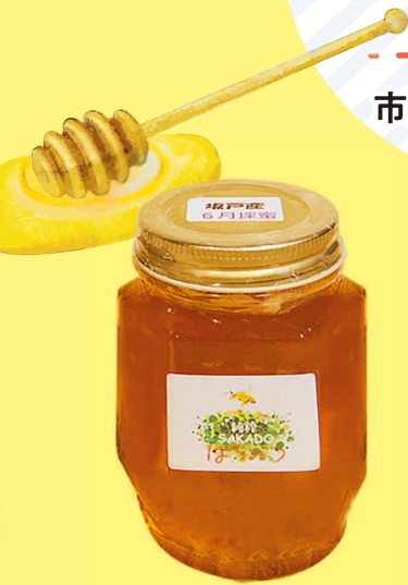
町ナカふれあい農園 純粋坂戸はちみつ

市内の事業者がこだわりをもって作った商品「さかど自慢の逸品」を 販売するミニマルシェを坂戸駅南北自由通路で開催します。