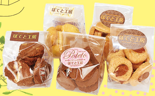
ぼてと工房 クッキーセット