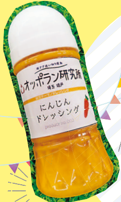
山田ふみ にんじんだレッシング