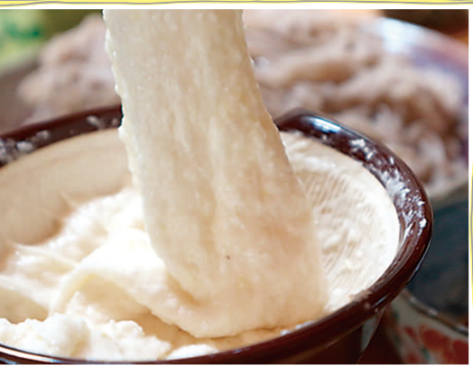
マサキファーム 自然薯