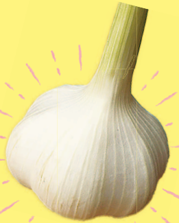
veggiesland 坂戸パワーにんにく