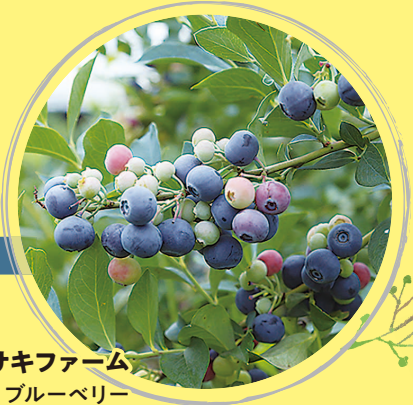
マサキファーム ブルーベリー