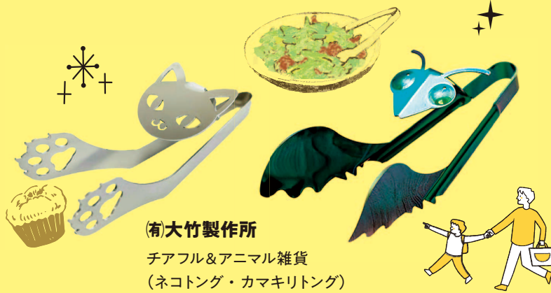
(有)大竹製作所 チアフル&アニマル雑貨 (ネコトング・カマキリトング)