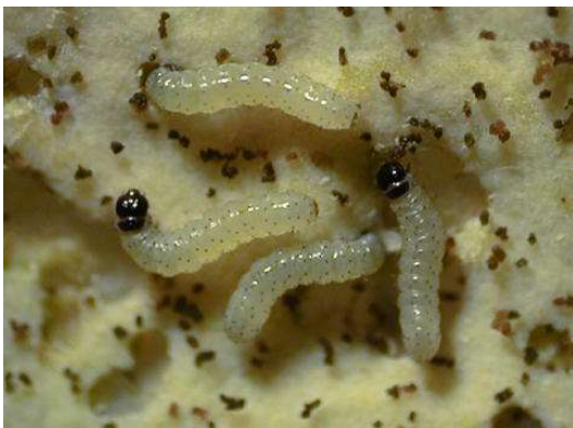
写真1 シロイチモジヨトウ若齢幼虫 (体長約2mm)