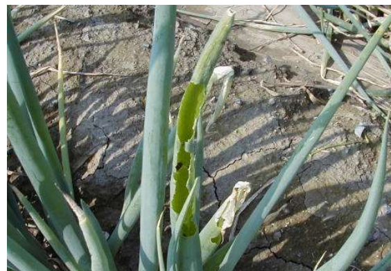
写真2 シロイチモジヨトウによる被害葉