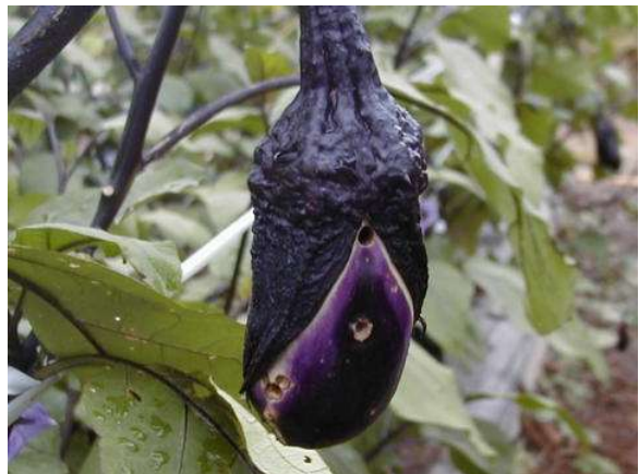
写真2 オオタバコガ幼虫による果実の侵入痕