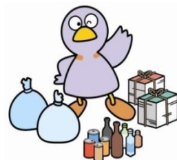
埼玉県マスコット「コパトン」

現在、県内では年間約54万トンの事業系ごみが排出されています。ごみの最終処分場の残余容量がひっ迫している中、ごみの削減は重要な課題です。限りある資源を有効に活用するためにも、以下のチェック項目を参考に、一層のごみ減量・リサイクルに取り組みましょう。