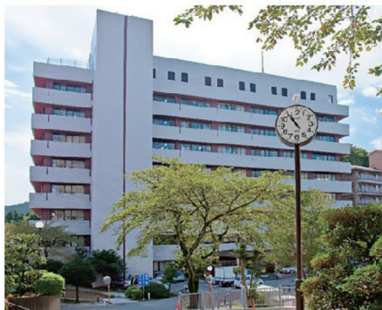
認知症疾患医療センター(丸木記念福祉メディカルセンター)受診の流れ

認知症疾患医療センターは、埼玉県の指定を受けた認知症専門機関で、認知症に関する鑑別診断、周辺症状や合併症への対応、専門医療相談を行っています。