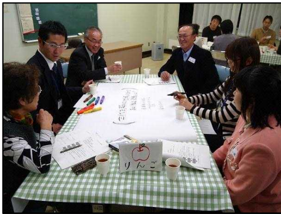
ワールドカフェの様子