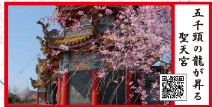
五千頭の龍が昇る 聖天宮