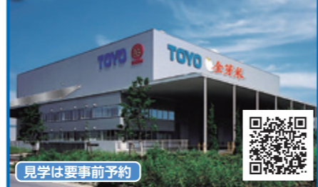
⑥ 東洋ライスサイタマ工場

大学創始者である水田三喜男が蒐集した浮世絵200点以上のコレクションを公開。浮世絵の発生期から近代日本画までの歴史をたどれます。その他企画展も開催。