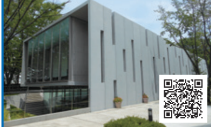
⑤ 城西大学 水田美術館

大学創始者である水田三喜男が蒐集した浮世絵200点以上のコレクションを公開。浮世絵の発生期から近代日本画までの歴史をたどれます。その他企画展も開催。