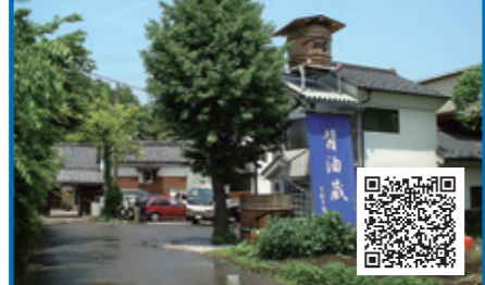
④ 弓削多醤油(株) 醤油王国

大正12年に創業、200年以上の歴史があり、国産の原料を使い「醤油は調味料なのでうまくなければ意味がない。」との考えを守り製造しています。