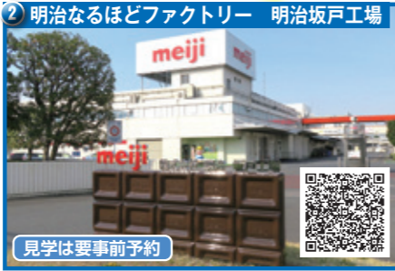
② 明治なるほどファクトリー 明治坂戸工場

国内最大級台湾のお宮。龍をモチーフとした装飾・彫刻が五千頭あります。色鮮やかな屋根飾りは異国情緒満載。本場台湾の開運参拝やおみくじ体験ができます。