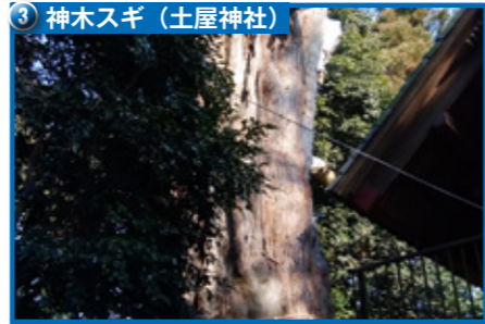
③ 神木スギ (土屋神社)

樹齢千年を超える老杉(県指定の天然記念物)で、樹高17.0m、樹周8.5m、根まわり11.3mと巨樹。雄大な枝ぶりは健在で、春には新しい芽吹きも見られます。