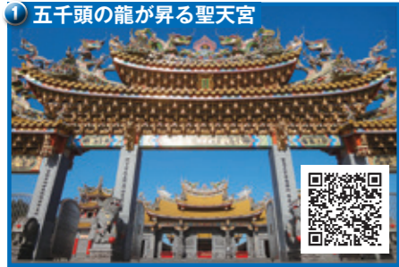
① 五千頭の龍が昇る聖天宮

国内最大級台湾のお宮。龍をモチーフとした装飾・彫刻が五千頭あります。色鮮やかな屋根飾りは異国情緒満載。本場台湾の開運参拝やおみくじ体験ができます。